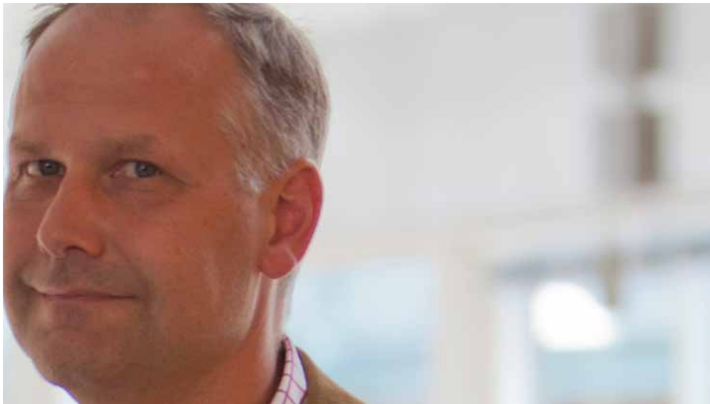
Vänsterpartiets nya ordförande Jonas Sjöstedt.