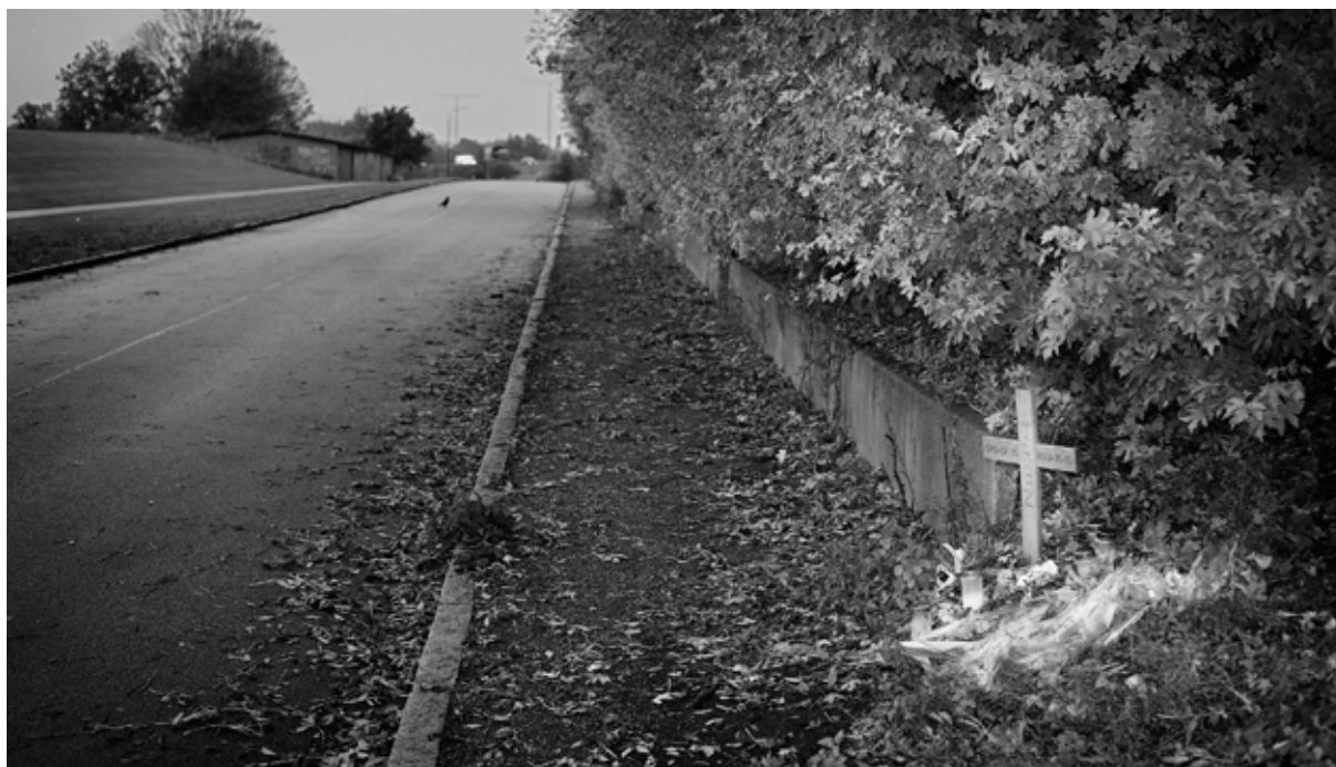
I oktober 2009 sköts en 20-årig kvinna på Rosengård, hon satt tillsammans med en utländsk kompis i en bil.